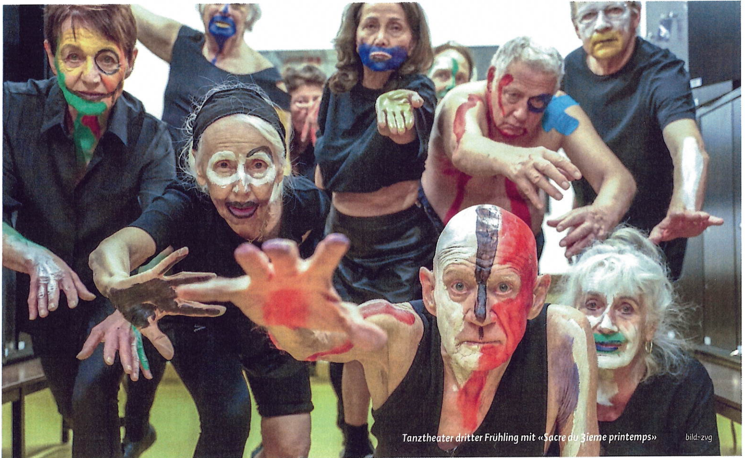
Tanztheater dritter Frühling mit «Sacre du 3ieme printemps»